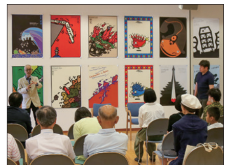
作品解説 / 中之口先人館 / 2018年8月25日