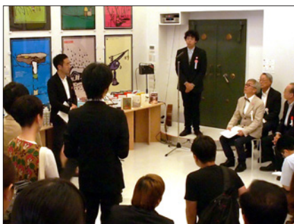
「日本ブックデザイン賞2015」授賞式 / 2015年9月12日