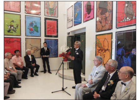
APM開館5周年記念式典 / 2014年7月12日