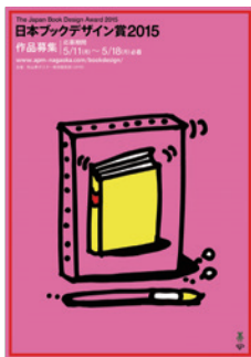
日本ブックデザイン賞2015 作品募集