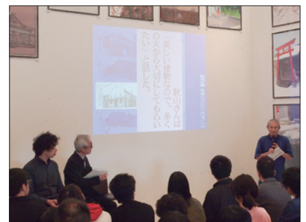
第32回美術館大学「登録有形文化財について」 / 2016年4月16日