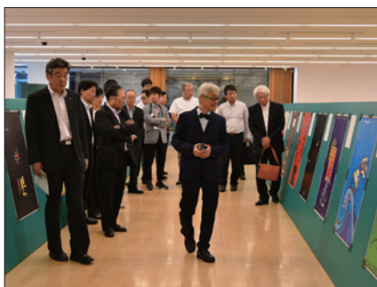
オープニング / アオーレ長岡 / 2017年9月1日