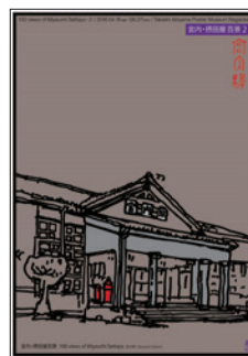
宮内・撰田屋百景展2 - 宮内駅