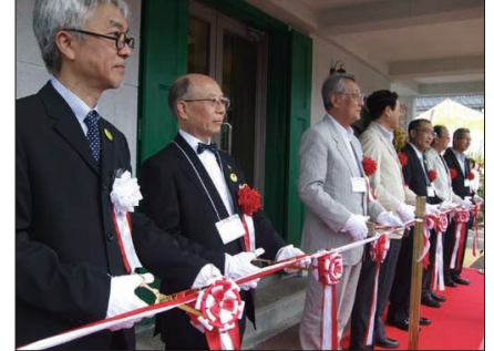
APM開館 テープカット / 2009年7月11日