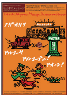
まちなかミュージアム2017