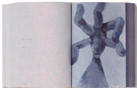
金の本賞 / 学生部門・私家版 柏 大輔 (多摩美術大学)