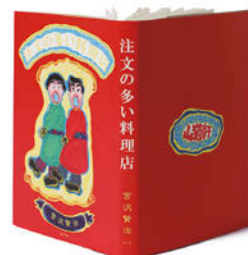
銀の本賞 / 学生部門・ブックジャケット (文庫判) 齋藤輝美 (多摩美術大学)