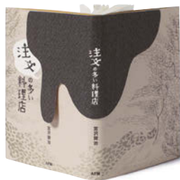
金の本賞 / 一般部門・ブックジャケット (文庫判) 安藤紫野