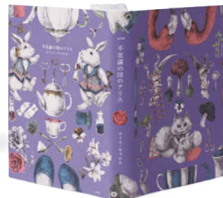
銀の本賞 / 学生部門・ブックジャケット (四六判) 竹内祥子 (多摩美術大学)