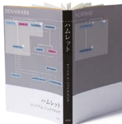
金の本賞 / 学生部門・ブックジャケット (文庫判) 藤田由美 (千葉大学)