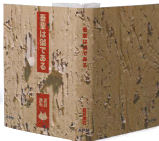
金の本賞 / 学生部門・ブックジャケット (四六判) 高橋亮次 (京都嵯峨芸術大学)