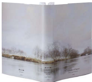
金の本賞 / 一般部門・ブックジャケット (四六判) 上清涼太 / 日下潤一 (写真)