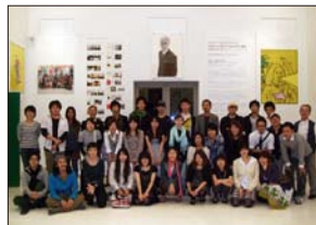
(上) 授業・大学院生作品講評会 (下) 学生展記念交流会