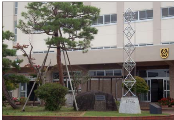
新潟県立長岡商業高等学校 創立100周年記念モニュメント「百年の風」