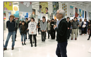
地震ポスター支援プロジェクト・イラストレーションポスター展 (上) 特別講義風景、(下) 合同講評会風景