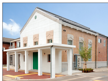
APM (本館) 外観