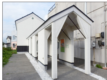
APM (本館) 外観