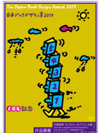
日本ブックデザイン賞2019 作品募集ポスター