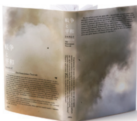
日本ブックデザイン賞2017 グランプリ 一般の部 ブックジャケット・四六判部門 上清 涼太『戦争と平和』