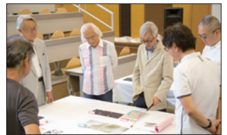
日本ブックデザイン賞2017 審査会にて (2017年7月22日)