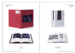
「日本ブックデザイン賞」作品集 JBD 公式ウェブサイトにて、入賞・入選した 全作品を掲載した作品集を頒売しております。 全頁カラー / 1冊 2,400円