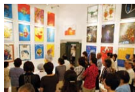
美術館ギャラリー

7月11日土曜日「秋山孝ポスター美術館長岡」の開館式典が行われた。梅雨の時期に花火と共に突然晴れやかな日が現れ、森民夫・長岡市長始め数多くの著名人が参列した。その中でテープカットが始まり、華やかな開館式典とオープニングが開かれた。翌日の開館には市民が数多く集まり、美術館の扉が開いた。歴史的建造物旧北越銀行修復後の輝くような白い壁の中に、鮮やかな色彩を持ったメッセージポスターの美しさが表れ出した。その感動と共感、ため息と共に静かなささやきが響き渡り、その空間を包み込んだ。開館記念「秋山孝ポスター展」が10月9日(金)まで開催される。歴史ある醸造の街に超モダンなポスターデザインの世界が花開いた。新しい文化がスタートし、秋山孝ポスター美術館サポーターズ倶楽部の支援のもとに市民が作り上げた美術館が誕生した。