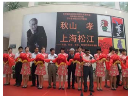
展覧会オープニングセレモニー (テープカット)