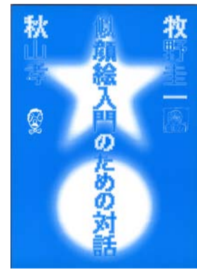
似顔絵入門のための対話 / 1991 / ワンバク王国友の会

1952年長岡市生まれ。上組小学校、宮内中学校、長岡商業高等学校、多摩美術大学卒業。東京芸術大学大学院修了。1986年、自然保護ポスター「WILD LIFE-HELP」でワルシャワ国際ポスタービエンナーレ・金賞を受賞し、1998年、インド核実験反対のポスターで国連賞を受賞する。他、各国のビエンナーレにおいて多数受賞。フィンランド、メキシコ、イタリア、ウクライナ、中国で国際ポスター展の審査員として招聘される。著書に「キャラクターコミュニケーション入門」(角川書店)「Chinese Posters」(朝日新聞出版)他多数。