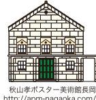
秋山孝ポスター美術館長岡 http://apm-nagaoka.com/

秋山 孝 多摩美術大学教授・秋山孝ポスター美術館長岡/館長 1952年長岡市生まれ。上越小学校、宮内中学校、長岡商業高等学校、多摩美術大学卒業。東京藝術大学大学院修了。1986年、自然保護ポスター「WILD LIFE-HELP」でワルシャワ国際ポスタービエンナーレ・金賞を受賞し、1998年、インド核実験反対のポスターで国連賞を受賞する。他、各国のビエンナーレにおいて多数受賞。フィンランド、メキシコ、イタリア、ウクライナ、中国、アメリカで国際ポスター展の審査員として招聘される。著書に「キャラクターコミュニケーション入門」(角川書店)「Chinese Posters」(朝日新聞出版)他多数。