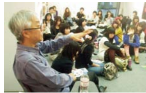
(上) 東京工芸大学、多摩美術大学 地震ポスター展2009 (中) 講評会 (下) 講義