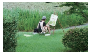
(上)「会場風景」 (下)「多摩美大キャンパス」