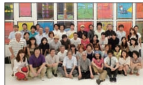
(上)「第11回美術館大学風景」 (下)「懇親会集合写真」