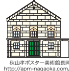
秋山孝ポスター美術館長岡 http://apm-nagaoka.com/

秋山 孝 多摩美術大学教授・秋山孝ポスター美術館長岡/館長 1952年長岡市生まれ。上郷小学校、宮内中学校、長岡商業高等学校、多摩美術大学卒業。東京藝術大学大学院修了。1986年、自然保護ポスター「WILD LIFE-HELP」でワルシャワ国際ポスタービエンナーレ・金賞を受賞し、1998年、インド核実験反対のポスターで国連賞を受賞する。他、各国のビエンナーレにおいて多数受賞。フィンランド、メキシコ、イタリア、ウクライナ、中国、アメリカで国際ポスター展の審査員として招聘される。著書に「キャラクターコミュニケーション入門」(角川書店)「Chinese Posters」(朝日新聞出版)他多数。