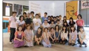
「メッセージイラストレーションポスター展 ギャラリー風景」

[Title] ----- メッセージイラストレーションポスター展 [Size] ----- 1030 x 728 mm (B1) [Technique] --- Offset printing [Date] ----- 2011 [Client] ----- 多摩美術大学イラストレーションスタディーズ [Category] --- 教育 [Idea] ----- アクナトン王の王女メリタンの美しい神秘的表情を描いた。彼女の細長く突き出ている頭部のフォルムは、紀元前1567～1320年頃の黄金エジプト王朝の美的なメッセージだ。