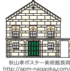
秋山孝ポスター美術館長岡 http://apm-nagaoka.com/

秋山 孝 多摩美術大学教授・秋山孝ポスター美術館長岡/館長 1952年長岡市生まれ。上稲小学校、宮内中学校、長岡商業高等学校、多摩美術大学卒業。東京藝術大学大学院修了。1986年、自然保護ポスター「WILD LIFE-HELP」でワルシャワ国際ポスタービエンナーレ・金賞を受賞し、1998年、インド核実験反対のポスターで国連賞を受賞する。他、各国のビエンナーレにおいて多数受賞。フィンランド、メキシコ、イタリア、ウクライナ、中国、アメリカで国際ポスター展の審査員として招聘される。著書に「キャラクターコミュニケーション入門」(角川書店)「Chinese Posters」(朝日新聞出版)他多数。