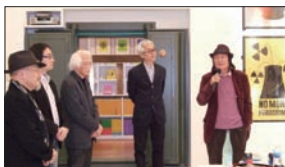
(上)「ノー・モア・フクシマ/美術館大学」 (下)「ノー・モア・フクシマ/オープニングパーティー」