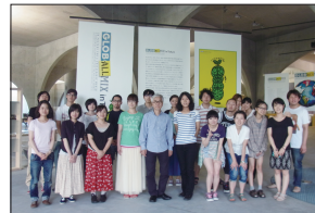
(上)「展示会場:多摩美術大学図書館ギャラリー」 (下)「多摩美術大学 大学院授業風景」

[Title] ----- GLOB-ALLMIX in Tokyoポスター展 国連・持続可能な開発会議「Rio+20」 [Size] ----- 1030 x 728 mm (B1) [Technique] --- Offset printing [Date] ----- 2012 [Client] ----- GLOB-ALLMIX in Tokyoポスター展実行委員会 [Category] --- 文化 [Idea] ----- ポスターデザインは、持続可能な地球をイメージし、新たなグリーン世界とその調和の芽吹きを明るさを表した。