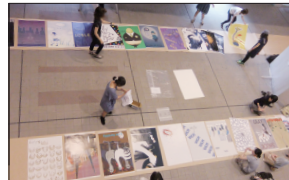
(上) 展覧会設営メンバー集合写真 (下) 展覧会設営風景