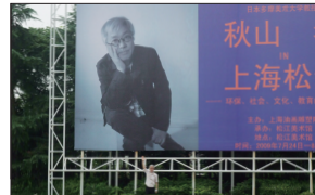
(上) 2009年秋山孝個展/会場・上海 松江美術館 (下) 展覧会ビルボード