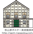
秋山孝ポスター美術館長岡 http://apm-nagaoka.com/

秋山 孝 多摩美術大学教授・秋山孝ポスター美術館長岡/館長 1952年長岡市生まれ。上郷小学校、宮内中学校、長岡商業高等学校、多摩美術大学卒業。東京藝術大学大学院修了。1986年、自然保護ポスター「WILD LIFE-HELP」でワルシャワ国際ポスタービエンナーレ・金賞を受賞し、1998年、インド核実験反対のポスターで国連賞を受賞する。他、各国のビエンナーレにおいて多数受賞。フィンランド、メキシコ、イタリア、ウクライナ、中国、アメリカ、ポーランドで国際ポスター展の審査員として招聘される。著書に「Chinese Posters」(朝日新聞出版)、「イラストレーションスタディーズ」(玄光社)他多数。