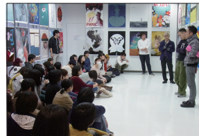
(上)地震ポスター支援プロジェクト/東京工科大学 中野校舎/講義 (下)地震ポスター支援プロジェクト/東京工科大学 中野校舎/作品講評会