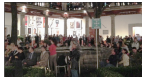
(上) 第13回メキシコ国際ポスタービエンナーレ/会場風景 (下) オープニングレセプション/2014年10月27日