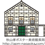
秋山孝ポスター美術館長岡 http://apm-nagaoka.com/

秋山 孝 多摩美術大学教授・秋山孝ポスター美術館長岡/館長 1952年長岡市生まれ。多摩美術大学卒業。東京藝術大学大学院修了。2009年「秋山孝ポスター美術館長岡」、2013年「秋山孝ポスター美術館長岡・蔵」が完成。1986年、自然保護ポスター「WILD LIFE-HELP」でフルシャフ国際ポスタービエンナーレ・金賞を受賞し、1998年、インド核実験反対のポスターで国連賞を受賞。他、多数受賞。フィンランド、メキシコ、イタリア、ウクライナ、中国、アメリカ、ポーランド、他で国際ポスター展の審査員として招聘。著書に「Chinese Posters (中国ポスター)」、「朝日新聞出版」、「イラストレーションスタディーズ」(玄光社)他多数。