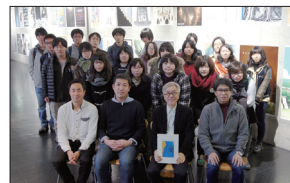
地震ポスター支援プロジェクト 4大学合同展覧会 (上) 東京工芸大学、(下) 長岡造形大学