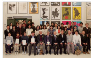
「イラストレーション・ダイアログ」展 (上) 第27回美術大学、(下) 展覧会集合写真

[Title] ----- 「イラストレーション・ダイアログ」展 [Size] ----- 1030 x 728 mm (B1) [Technique] --- Offset printing [Date] ----- 2015 [Client] ----- 秋山孝ポスター美術館長岡 (APM) [Category] --- 文化 [Idea] ----- 対話 (ダイアログ) と題した展覧会の特徴を表すために、対峙する両手を使った。そこには想像を越えた出会いがあったり、新たな概念を生み出そうとするイメージをシンボリックに表した。