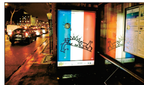
「Célébrer la Terre」ポスター展示風景/パリ、シャンゼリゼ大通り (上)ポスター解説/ミシェル・ブーヴェ、(下)ポスター・ライトアップ