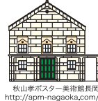
秋山孝ポスター美術館長岡 http://apm-nagaoka.com/

秋山 孝 多摩美術大学教授・秋山孝ポスター美術館長岡/館長 1952年長岡市生まれ。多摩美術大学卒業。東京藝術大学大学院修了。2009年「秋山孝ポスター美術館長岡」、2013年「秋山孝ポスター美術館長岡・蔵」が完成。1986年、自然保護ポスター「WILD LIFE-HELP」でワルシャワ国際ポスタービエンナーレ・金賞を受賞し、1998年、インド核実験反対のポスターで国連賞を受賞。他、多数受賞。フィンランド、メキシコ、イタリア、ウクライナ、中国、アメリカ、ポーランド、他で国際ポスター展の審査員として招聘。著書に「Chinese Posters(中国ポスター)」、「朝日新聞出版」、「イラストレーションスタディーズ」(玄光社)他多数。