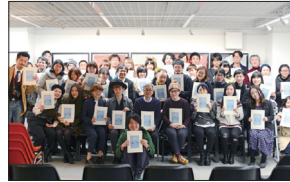
多摩美術大学大学院グラフィックデザイン研究領域イラストレーションスタディーズ修了制作展2015/ (上) トークショー、(下) 集合写真