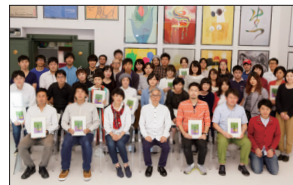
メッセージ・イラストレーション・ポスター展7 (上) 第31回美術館大学講演風景、(下) 集合写真