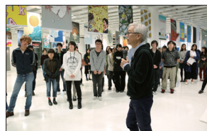
地震ポスター支援プロジェクト・イラストレーションポスター展 (上) 特別講義風景、(下) 合同講評会風景