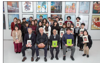
第10回メッセージイラストレーションポスター展 (上) 展示会場風景 (下) 集合写真