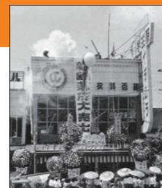
イチムラ百貨店開店(昭和29年)