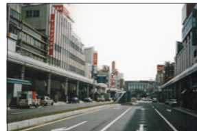
ザ・プライス丸大と大手通り(平成10年頃)

昭和37年(1962) 平成元年(1989) 平成13年(2001) 丸大 ▶ ザ・プライス丸大 ▶ 市民センター