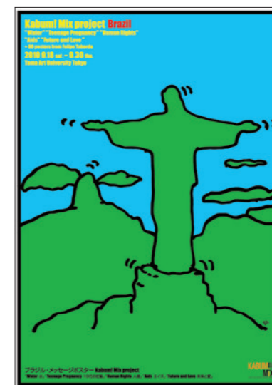
KABUMI! Mix / 2010