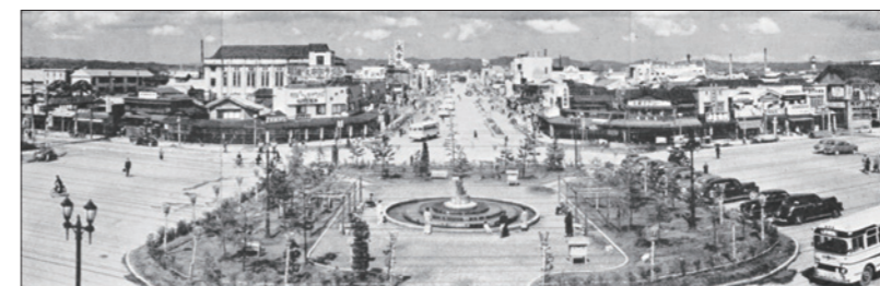
長岡駅前平和像と大手通り(昭和30年)