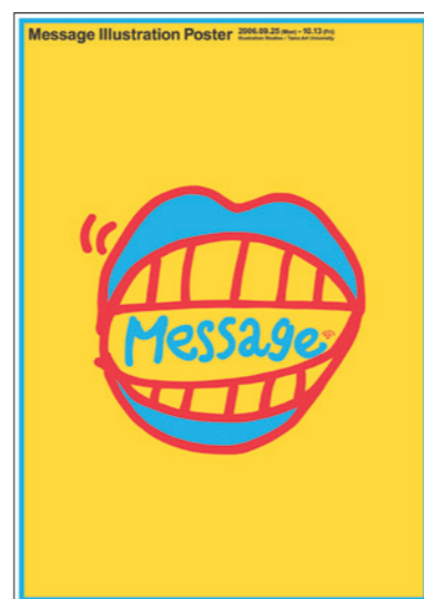
メッセージイラストレーションポスター展 / 2006