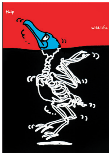
Wild Life Help (oil bird) / 1991