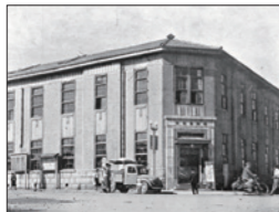
戦災後、修理された市役所庁舎(昭和21年)

明治3年(1870) 明治39年(1906) 昭和33年(1958) 平成22年(2010) 国漢学校 ▶ 市役所 ▶ 大和百貨店 ▶ カーネーションプラザ