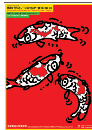
東方のイラストレーションポスター展 中国・韓国・日本 / 2007