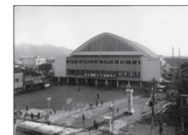
竣工直後の厚生会館(昭和33年)