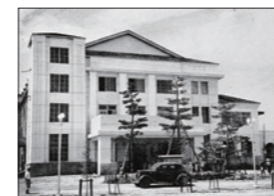
親しまれた公会堂(昭和32年)